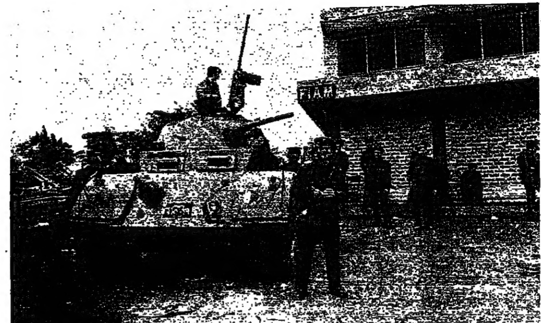
قوة من رجال الدرك معززة بصفحة تابعة لقوى الأمن الداخلي في الشياح

على صعيد الامن، أعلن مسؤول إداريات قوى الأمن المركزي، في منشرة في شوارع العاصمة، وهي مزودة بأوامر تفويض بإطلاق النار على كل من يطلق الرصاص. وقالت مصادر قوى الأمن ان دوريتها المعززة بالصفحات استلمت مراكزها في